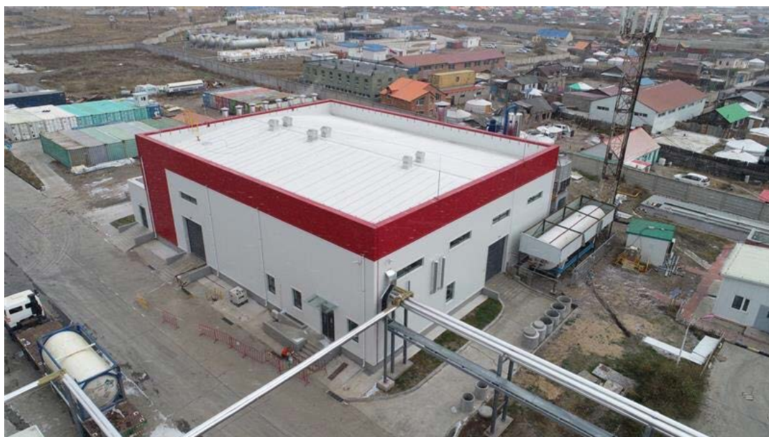
Зураг.3. Үйлдвэрийн зураг