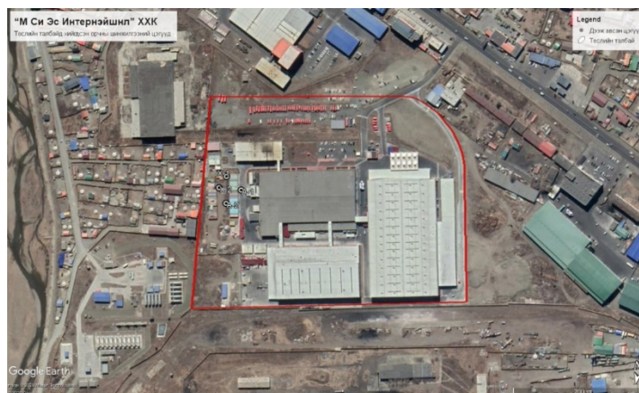
Зураг.4.Орчны шинжилгээний цэг. Үүнд; Х – Хөрсний дээж 2