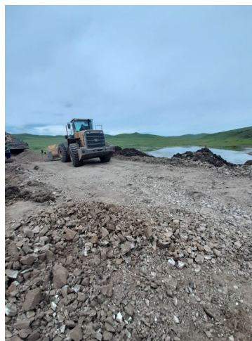
зас засаж буй нь