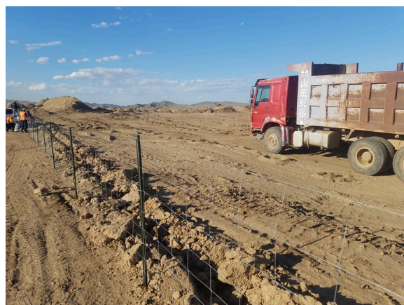
Биологийн нөхөн сэргээлтийн талбайг хашаажуулж буй байдал