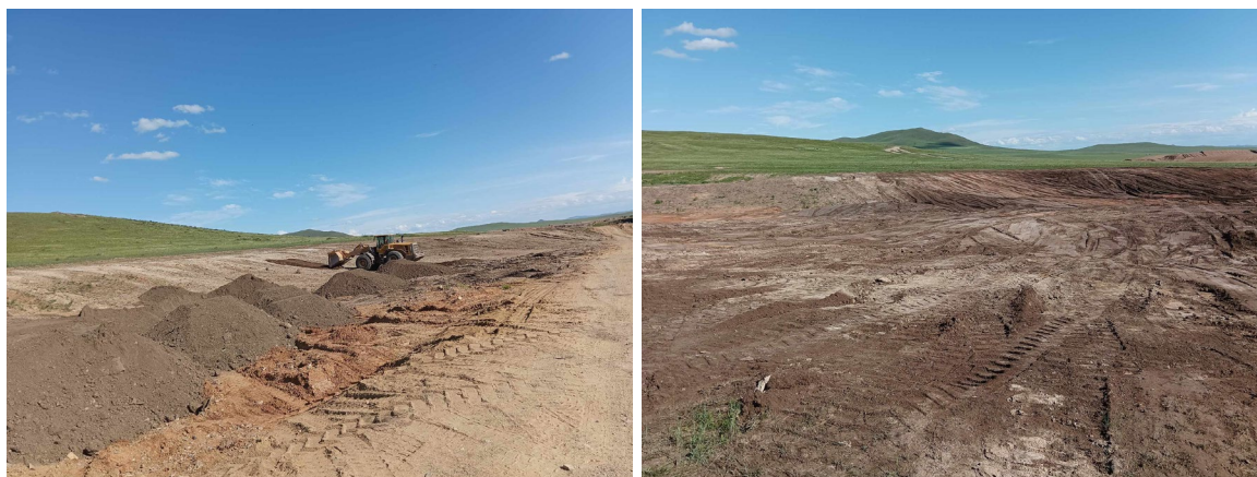
Шимт хөрсөөр хучиж буй нь