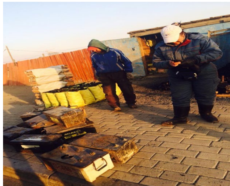
УБ хотод хаягдал аккумулятороо авчирч тушааж буй нь