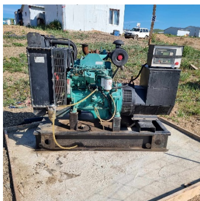
Дизель генераторын суурийг хатуу хучилттай болгосон нь