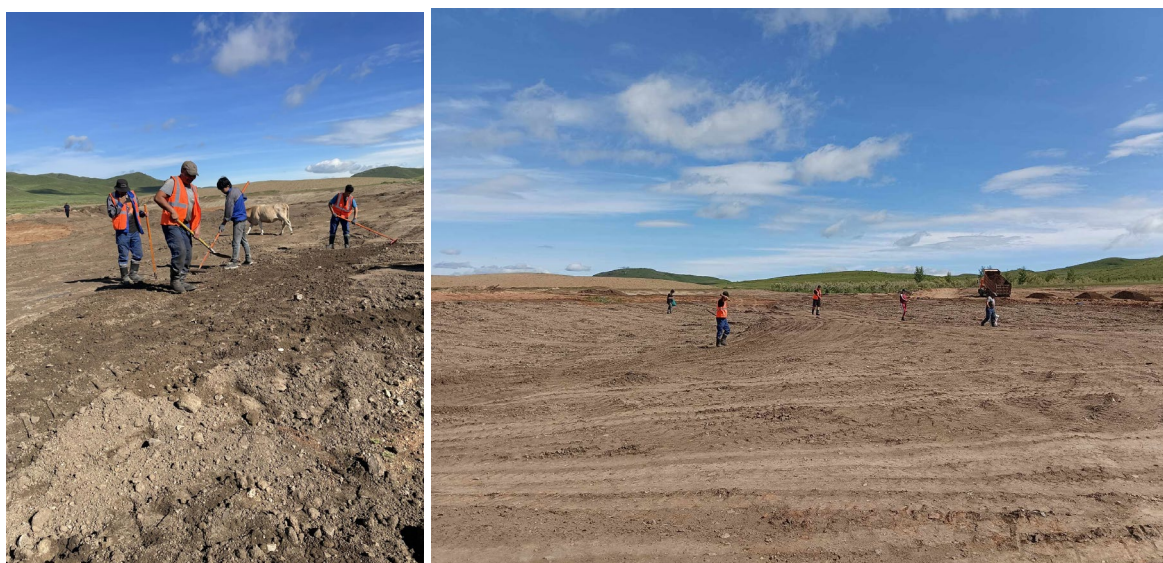
Олон настын үр суулгаж буй нь