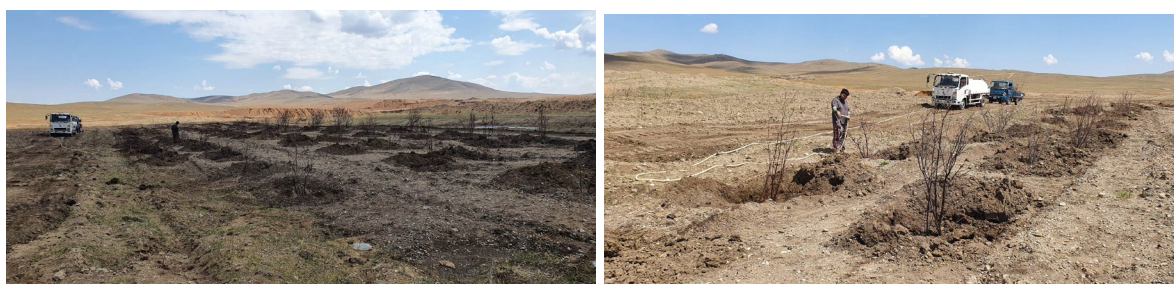
Чацарганы суулгац суулгаж буй нь