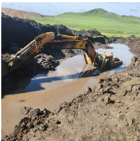
Засаагүй байхад үед