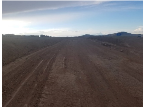
Зам түрж /хусаж / зассан байдал

Тоосжилт буруулах, үүссэн тоосжилтыг багасгаж арилгах төлөвлөгөөний нэг арга хэмжээ нь уурхайн дотоод тээврийн зам усалгааны ажил. Уурхайн дотоод тээврийн зам 1км-2км хүртэл зайтай хүнд даацын тээврийн хэрэгсэл зорчих замыг 7-10 хоногт, бороо устай үед зам хатаж тоосжилт үүсэх үед 310 тн усаар усалж тоосжилт дарж байлаа.