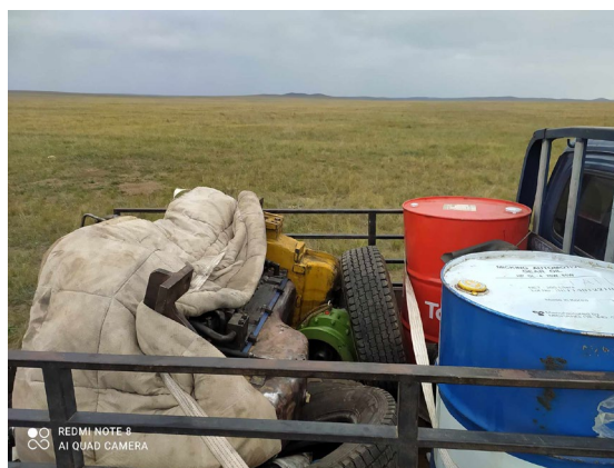
Хаягдал тосоо тушаахаар тээвэрлэж буй нь