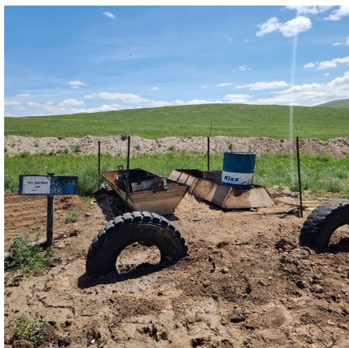
Хаягдал тос хадгалах түр цэг