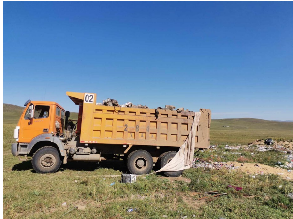
Ахуйн хогоо сумын хогийн цэгт асгаж буй байдал