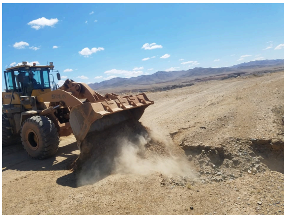
Эвдэрсэн зам засаж буй нь

Агаар орчинд нөлөөлөх, сөрөг нөлөөллийг буруулах ажлын хүрээнд уурхайн дотоод тээврийн замыг хайрган хучилтай болгож, хүнд даацын машин зорчиход шороо тоос босч агаар орчинд тоосжилт үүсгэхээс сэргийлж, тоосжилт үүсэх нөхцөлийг буруулж ажилласан.