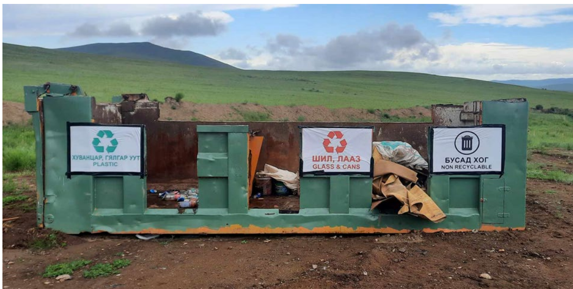
Ахуйн хог хаягдлаа ангилах хаяхаар зохин байгуулсан.