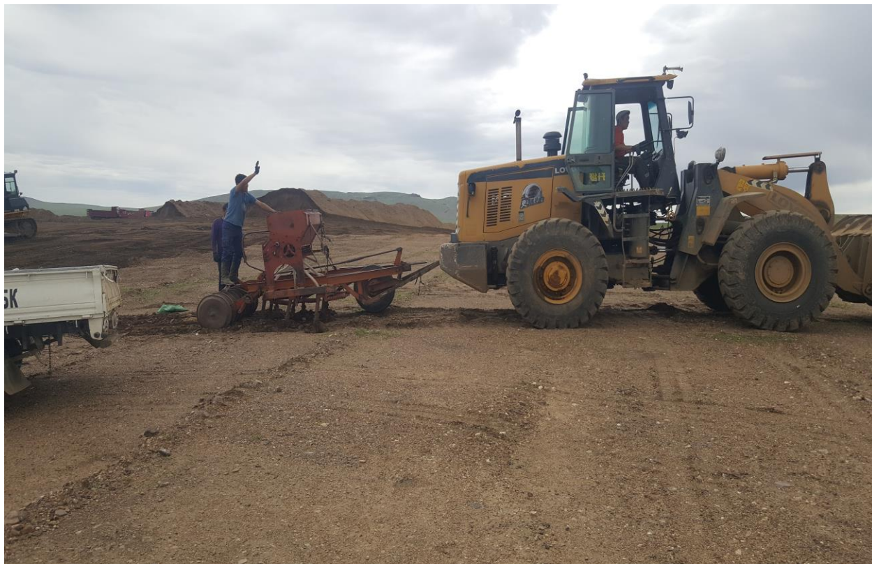
2023онд В5,В6 блок дээр Биологийн нөхөн сэргээлт хийсэн байдал