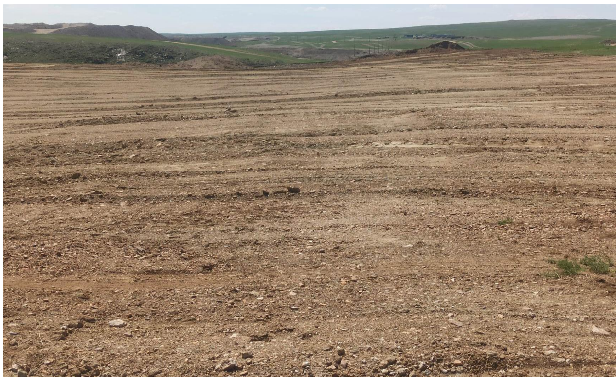
2023онд В3,С 2 блок дээр Биологийн нөхөн сэргээлт хийсэн байдал