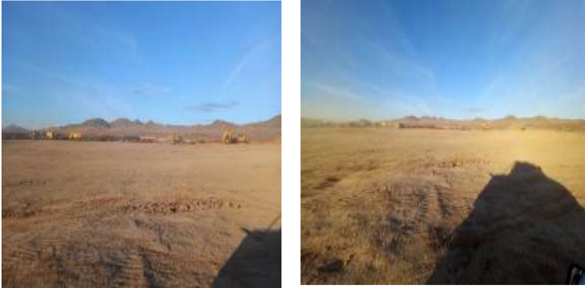
Зураг-11 ТНС-т хийгдэж буй явц