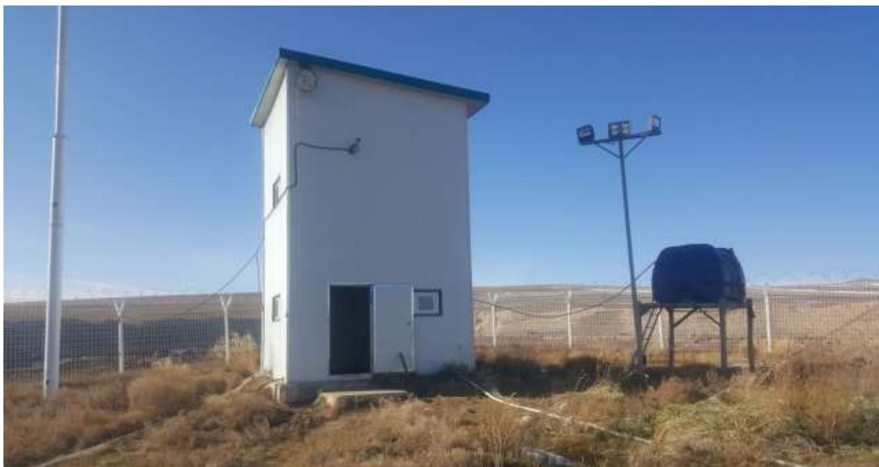
Зураг 2. Худгийн барилга,

Усан сангаас Д-320/50 насосоор угаах төхөөрөмжид ус шахаж өгнө. Нийт усан хангамжийн эргэлтийн хувь 75 орчим хувьтай байна.