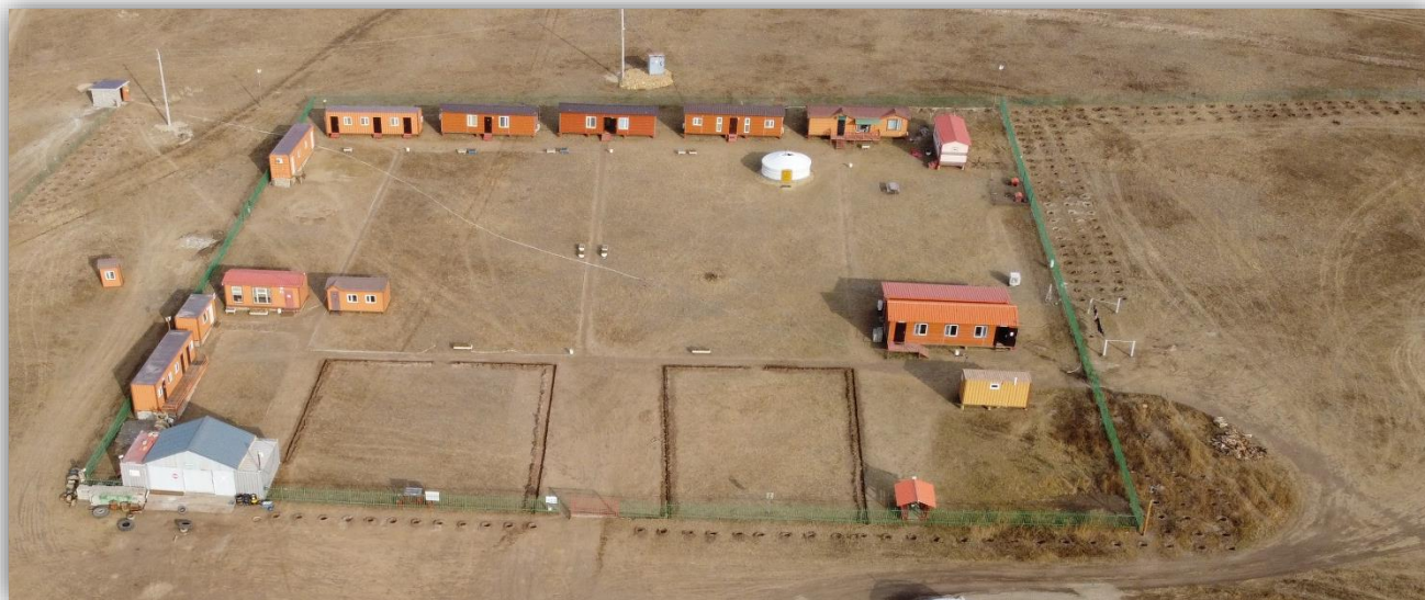
Зураг №. 4 Агаарын тоосжилт болон орчны тохижилтонд зориулж мод тарьсан.