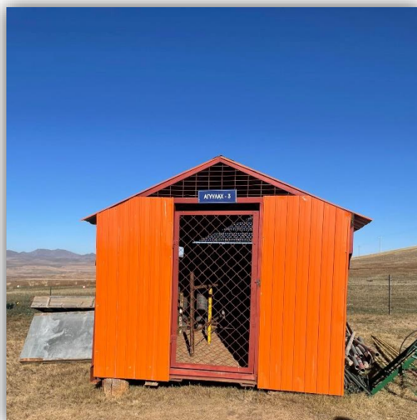
Зураг №. 6 ШТМатериалыг битүүмжлэлтэй саванд хадгалж байгаа нь

MV-021470 лиценз бүхий “Дунд наймганы хөндийн” алтны шороон ордын алт агуулсан баяжмалыг олборлон баяжуулахад усаар угаан хүндийн хүчний буюу гравитацийн аргаар баяжуулдаг учир ямар нэгэн химийн бодис хэрэглэх шаардлагагүй болно.