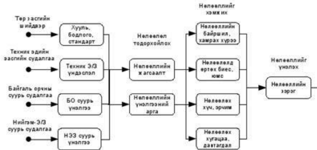
Зураг 2. Нөлөөллийн үнэлгээний үе шат

Байгаль орчинд нөлөөлөх сөрөг нөлөөлүүдийг жагсаахдаа байгаль орчны үндсэн 4 бүрэлдэхүүн хэсгүүдэд ангилан хүснэгтийн 2-р багана, 2-р мөрөөс эхлэн багана тус бүрд нэг нэгээр нь бичив. Тус төслийн үйл ажиллагаа байгаль орчны аль бүрэлдэхүүн хэсэгтэй харилцан үйлчлэлцэхийг хүснэгтэд тэмдэглэхдээ сөрөг нөлөөлөл үзүүлбэл Х, нөлөө үзүүлэхгүй бол 0, эерэг нөлөөлөл үзүүлбэл + тэмдэг зэргийг ашиглав.