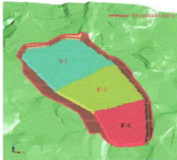
Зураг 2. Ил уурхайн хүрээ хязгаар

Ил уурхайн хүрээ хязгаар: Геологийн нөөцийн хайгуулын ажлаар тогтоогдсон 96 мян.м 3 элсийг хаягдалгүйгээр бүрэн олборлоно. Ашиглалтын явцад ил уурхайн хүрээнд 18.36 мян.м 3 хөрс, 103.17 мян.м 3 элс орж байна. Хөрс хуулалтын коэффициент ордын хэмжээнд 0.18 м 3 /м 3 байна. Уурхайн хүрээний нийт урт 637 м, уурхайн урт 236 м, уурхайн өргөн 115 м, газрын гадаргаас хамгийн гүн хэсэгтээ 14 м, хамгийн нам хэсэгтээ 4.9 м, дунджаар 7.4 м гүнтэй ил уурхай үүснэ.