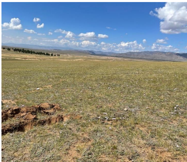
Зураг №. 2 Төсөл хэрэгжих талбайн ургамлан нөмрөгийн харагдах байдал

Арви: Ургамалжлын зүйлийн арвид О.Друдегийн нүдэн баримжааны аргаар үнэлгээг өгсөн.