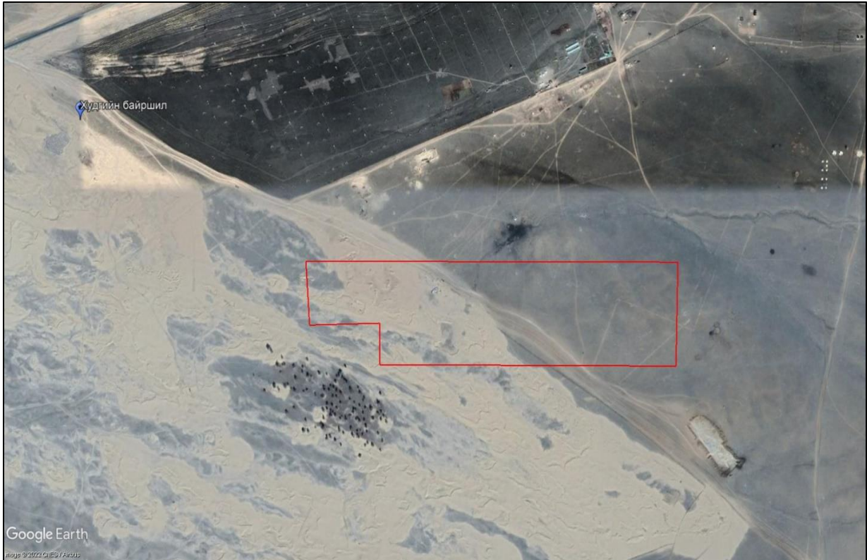
Зураг № 1 Худгийн байршил