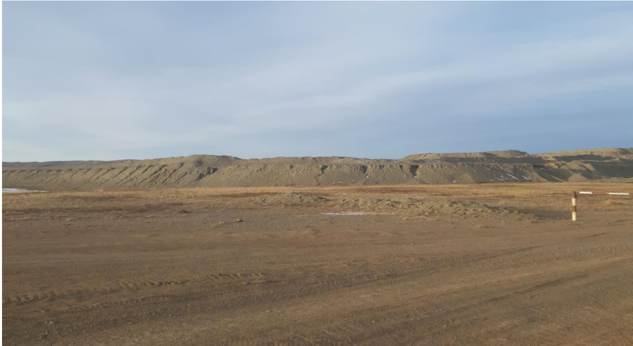
Зураг № 1. Төслийн талбай

MV-000456 ашиглалты тусгай зөвшөөрлийн дугаартай “Мухар эрэг, өвөр чулуут, сайрын худаг” алтны шороон ордыг ил уурхайн аргаар ашиглах төсөл: