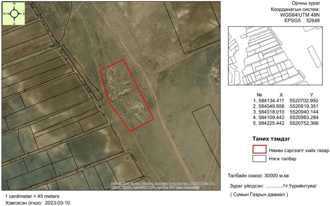
Зураг 4-1. 2023 онд нөхөн сэргээлт хийх газрын байршил