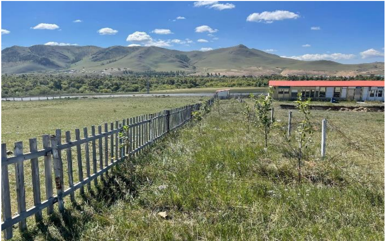
Зураг 3. Мод ургасан байдал

Ногоон байгууламжийн усалгаанд нөөц савнууд суурилуулж усалтын систем байгуулсныг 2022 онд хэвийн ажиллуулсан.