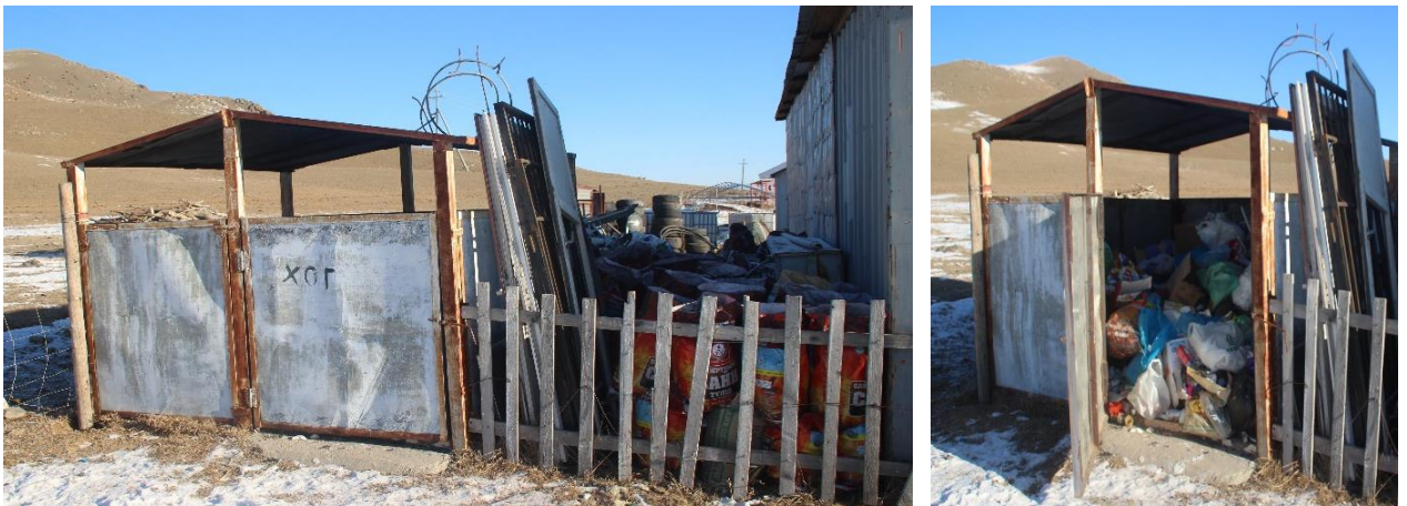
Зураг 5. Жуулчны баазын хатуу хаягдлын түр цэг

Манай компани 2022 оны үйл ажиллагаандаа Хог хаягдлын тухай хууль тогтоомжийг дагаж мөрдөн зориулалтын цэгээс өөр газарт хог хаягдал хаяхгүй байх, хог хаягдлыг ангилан ялгаж тээвэрлэгчид хүлээлгэн өгөх зэрэг арга хэмжээ авч ажилласан.