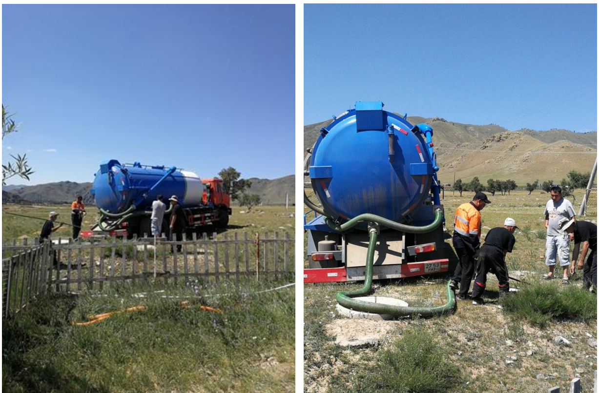
Зураг 9. Бохир соруулж буй байдал

Манай бааз зөвхөн дулааны улиралд ажилладаг тул сар бүр шингэн хаягдлаа бохир соруулах машин дуудаж зайлуулсан. Мөн ариутгал халдваргүйтгэл тогтмол хийлгэж ажилласан.