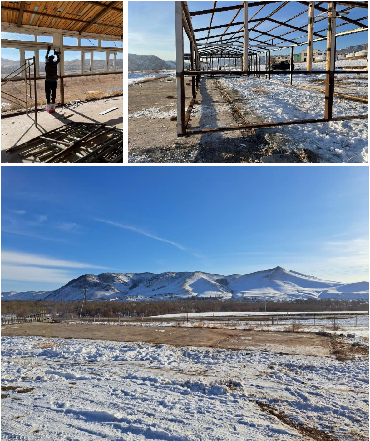
Зураг 14. Газар чөлөөлсөн байдал

Эзэмшил газрын дотогш татсан хэсэгт байрласан объектыг зөөвөрлөн холдуулсан. Харин шалны цементэн хэсгийг ирэх хавар ховхлон авч нөхөн сэргээлт хийн Горхи-Тэрэлжийн БЦГ-ын хамгаалалтын захиргаанд хүлээлгэн өгнө.