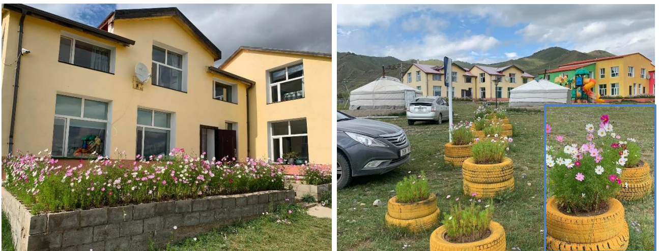
Зураг 2. Жуулчны баазын цэцгийн мандал

Харин жуулчны баазын цэцгийн мандалд цэцэг тарьсан.