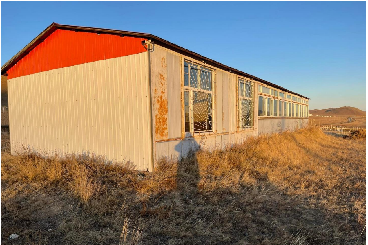
Зураг 13. Газар чөлөөлөхөөс өмнөх үеийн байдал

Жуулчны баазын газар урд талаараа усны хамгаалалтын бүстэй давхцсан тул БОАЖЯ-ны Ой, ус, тусгай хамгаалалттай газрын кадастрын хэлтсээс эргэлтийн цэгт өөрчлөлт оруулж давхацсан хэсэгт байрлах объектыг буулган нүүлгэж газар чөлөөлсөн.