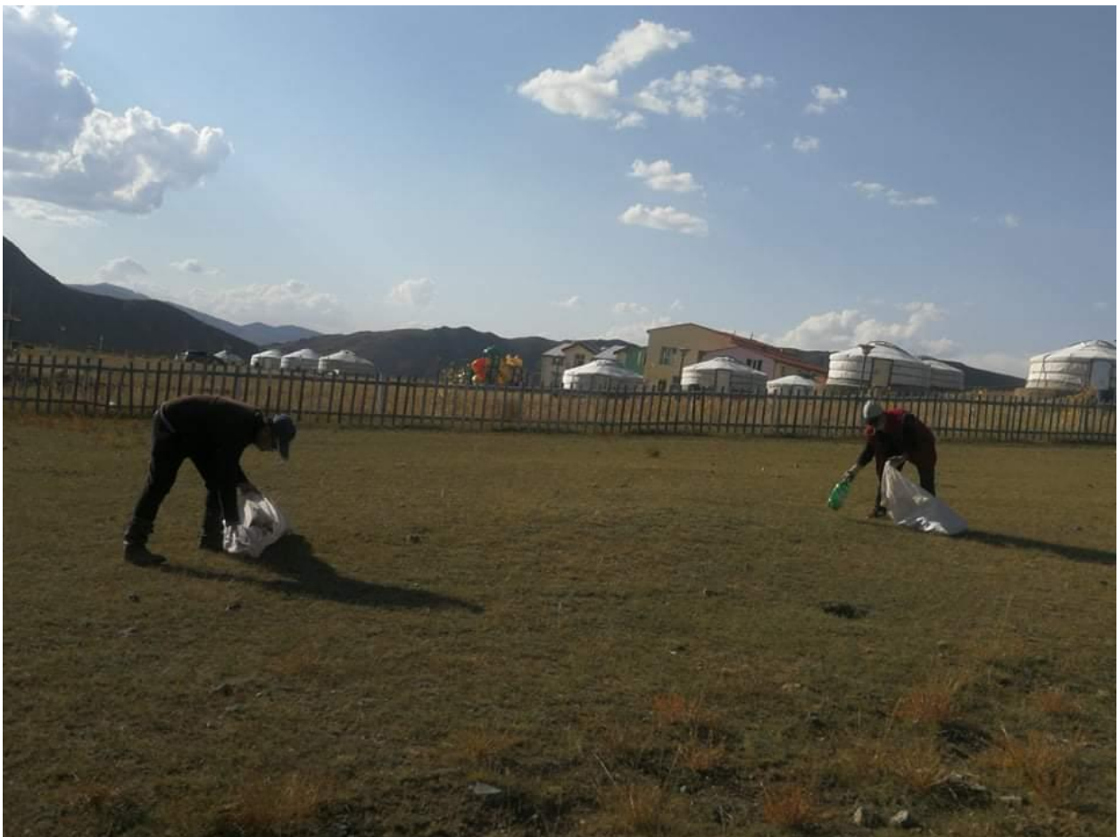
Зураг 8. Жуулчны баазын эргэн тойронд их цэвэрлэгээ хийсэн байдал