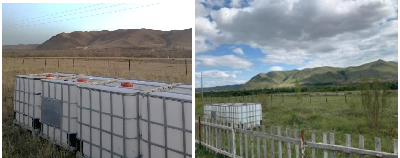
Зураг 4. Усалгаанд ашигладаг савнууд

Ногоон байгууламжийн усалгаанд нөөц савнууд суурилуулж усалтын систем байгуулсныг 2022 онд хэвийн ажиллуулсан.