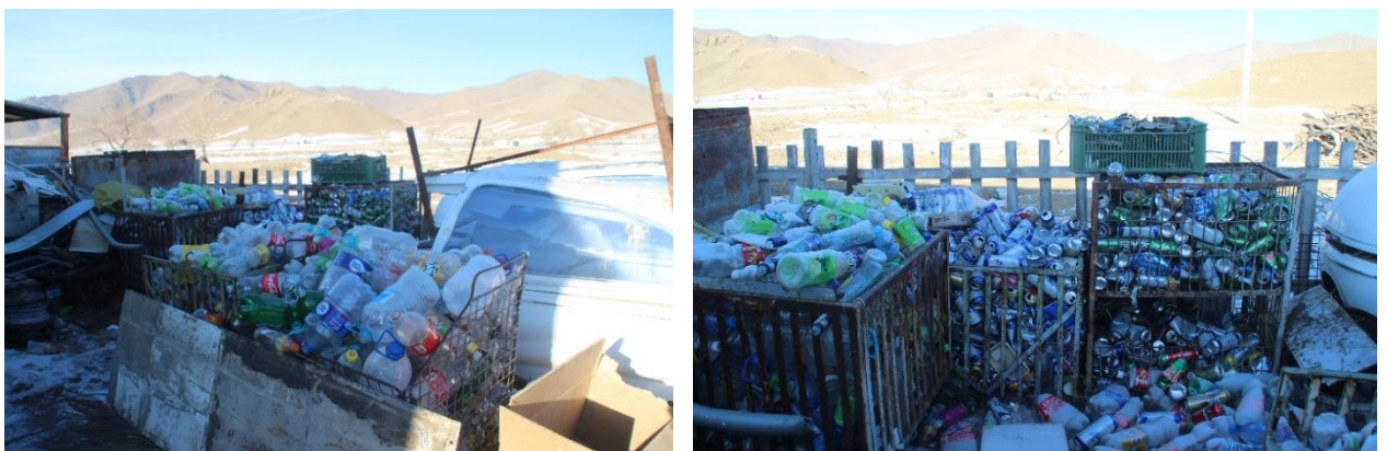
Зураг 6. Хуванцар болон шил лааз ангилаж хуримтлуулсан байдал