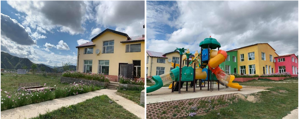
Зураг 1. Хатуу хучилттай явган хүний зам, тоглоомын талбай

“Хос хэрэм” жуулчны бааз нь газар эзэмших зөвшөөрөлтэй талбайг бүрэн хашаажуулсан хөрсний эвдрэл, бохирдлыг бага байлгах, унаган төрх байдал алдагдахаас сэргийлж 2022 онд дээр явган хүний зам, автомашины зогсоолын талбайг арчлан тордож, хөрсний эвдрэл, бохирдлоос сэргийлж ажилласан.