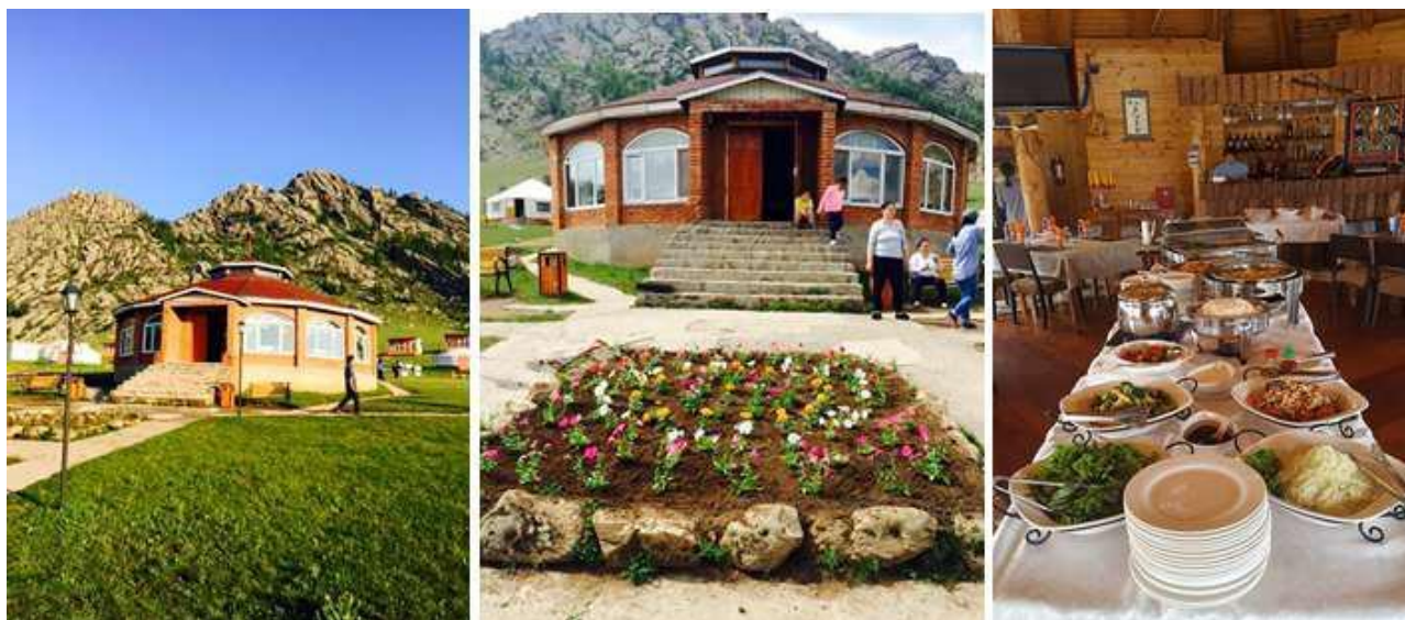
Зураг 5. Рестораны гаднах болон доторх байдал

Монгол гэр ресторан, гэр лаунж: Ресторан тус бүр нэг дор 30-40 хүн хүлээж авах хүчин чадалтай бөгөөд монгол үндэсний төрөл бүрийн хоол, хорхог, шорлог болон ази, европ хоолоор үйлчилдэг ба менюгээр болон өөрөө өөртөө үйлчлэх гэсэн хэлбэртэй. Энэ нь тусгайлан зассан саравчин дор шорлог хийх үйл явцыг тайлбартайгаар зочдод харуулан, гадаа задгай талбайд ардын урлагийн тоглолт үзэн байгалийн сайханд хооллох боломжтой.