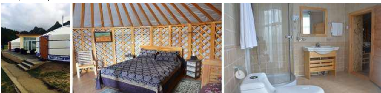
Зураг 4. Люкс гэрийн гаднах болон доторх байдал

Люкс гэр: Бааз нь нийт 16 люкс гэртэй. Люкс гэрүүд дотроо 00, душ бүхий ариун цэврийн өрөөтэй. Тус бүр 2 ортой (200x160 см, 200x130 см), хөргөгч, ус буцалгагч болон бусад төрлийн цахилгаан хэрэглэлтэй. Гэр бүрийн гадаа амарч тухлах талбайтай, сийрсэн ширээ сандалтай.