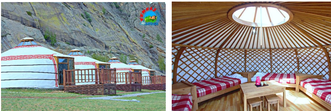
Зураг 3. Цомцог гэрийн харагдах байдал

Люкс гэр: Бааз нь нийт 16 люкс гэртэй. Люкс гэрүүд дотроо 00, душ бүхий ариун цэврийн өрөөтэй. Тус бүр 2 ортой (200x160 см, 200x130 см), хөргөгч, ус буцалгагч болон бусад төрлийн цахилгаан хэрэглэлтэй. Гэр бүрийн гадаа амарч тухлах талбайтай, сийрсэн ширээ сандалтай.