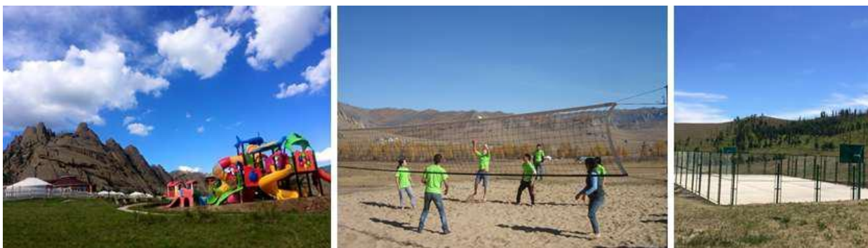
Зураг 7. Спортын тоглоомын талбай

Гэр музей: Монгол малчин айлын маягаар тохижуулсан музей гэрт зочдод нүүдэлчин малчин айлын амьдралын хэв маягийн талаар бүрэн ойлголт өгөхүйц эдлэл хэрэгслийг байрлуулсан бөгөөд баазад ирсэн зочин бүр үнэ төлбөргүйгээр энэ гэрт зочилж, төрөл бүрийн сүү, цагаан идээ, айраг таргаар дайлуулж, эртний эдлэлийг үзэж сонирхож болно. Хэрвээ зочин хүсвэл гэрт хоноглох боломжтой бөгөөд Монгол ахуй, түүх сожлын талаар лекц сонсох бүрэн боломжтой.