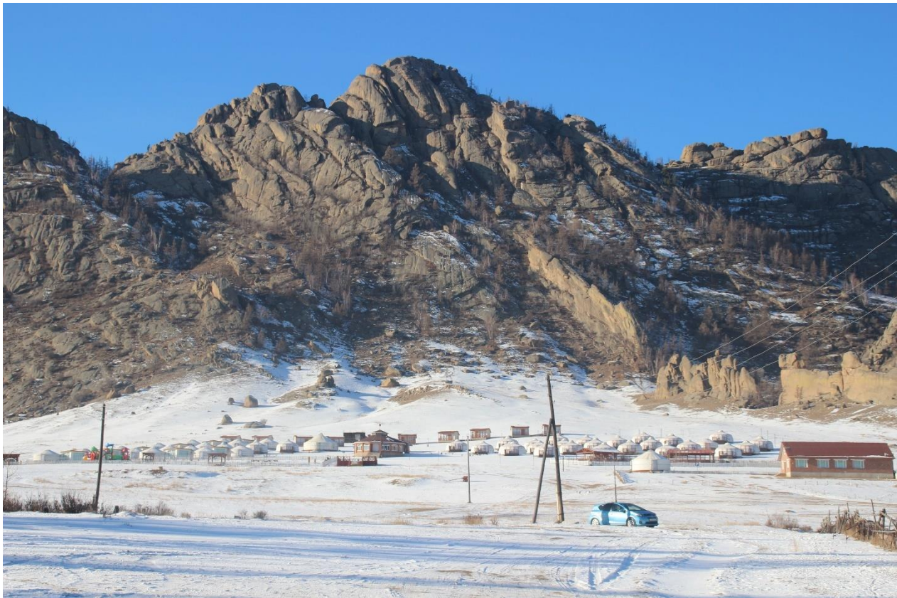
Зураг 1. “Тэрэлж лож” жуулчны баазын харагдах байдал