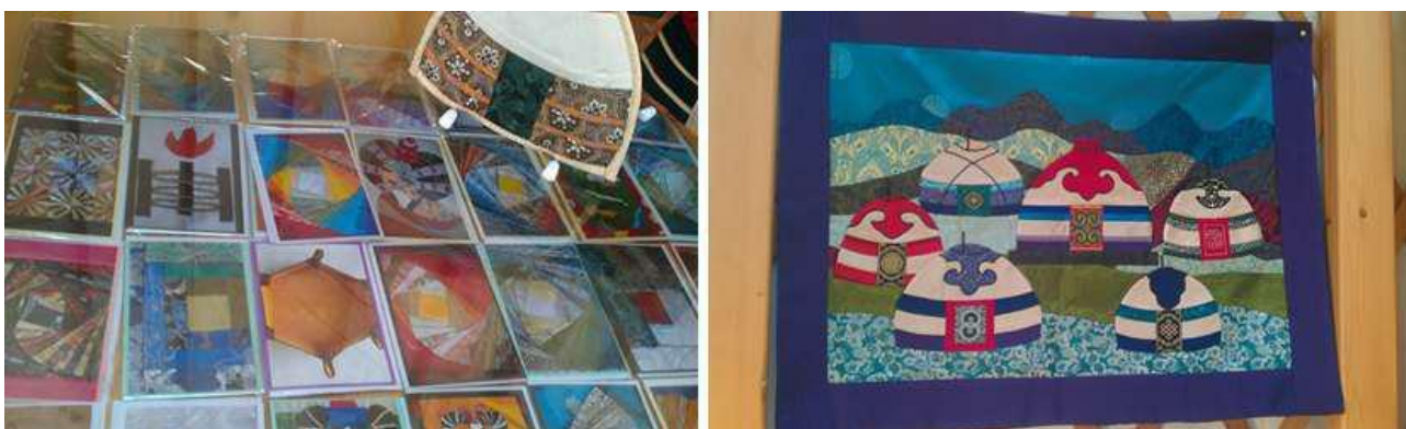
Зураг 9. Бэлэг дурсгалын дэлгүүр

Бэлэг дурсгалын дэлгүүр: Монгол үндэстний ахуй сожл, жс заншлыг харуулсан жижиг эдлэл, зүймэл даавуун урлалын бараа бүтээгдэхүүн бүхий бэлэг дурсгалын дэлгүүр нь гадаад, дотоодын жуулчдын сонирхлыг ихэд татдаг.