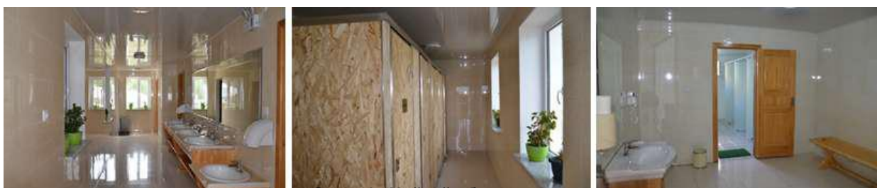
Зураг 15. Нийтийн бие засах газар

Ариун цэврийн өрөө: Бааз нь боловсон нийтийн бие засах газар, угаалга, душтэй Нийтийн 10 ширхэг 00, 16 ширхэг душ, 15 ширхэг угаалтуур бүхий ариун цэврийн өрөөнд мөн хүүхдэд зориулсан намхан угаалтуур, суултуур байрлуулсан байна.