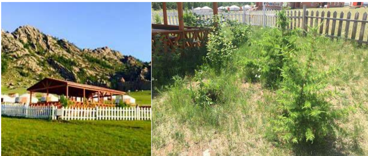
Зураг 14. Ногоон байгууламж, сүүдрэвч

Ариун цэврийн өрөө: Бааз нь боловсон нийтийн бие засах газар, угаалга, душтэй Нийтийн 10 ширхэг 00, 16 ширхэг душ, 15 ширхэг угаалтуур бүхий ариун цэврийн өрөөнд мөн хүүхдэд зориулсан намхан угаалтуур, суултуур байрлуулсан байна.