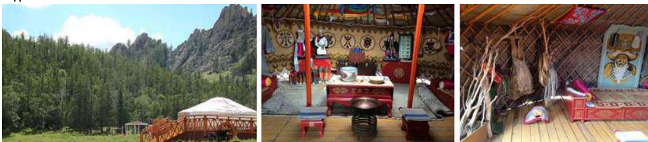
Зураг 8. Гэр музейн гаднах болон доторх байдал

Гэр музей: Монгол малчин айлын маягаар тохижуулсан музей гэрт зочдод нүүдэлчин малчин айлын амьдралын хэв маягийн талаар бүрэн ойлголт өгөхүйц эдлэл хэрэгслийг байрлуулсан бөгөөд баазад ирсэн зочин бүр үнэ төлбөргүйгээр энэ гэрт зочилж, төрөл бүрийн сүү, цагаан идээ, айраг таргаар дайлуулж, эртний эдлэлийг үзэж сонирхож болно. Хэрвээ зочин хүсвэл гэрт хоноглох боломжтой бөгөөд Монгол ахуй, түүх сожлын талаар лекц сонсох бүрэн боломжтой.