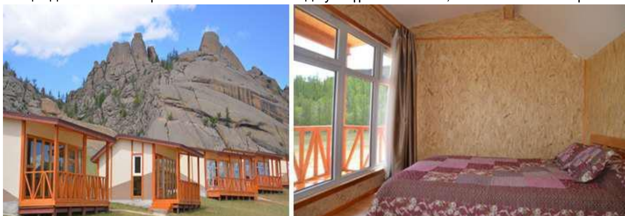
Зураг 8. Зуны байшингийн гаднах болон доторх байдал

Зуны байшин: Канад загвараар барьсан 10 ш модон байшин нь цаг агаарын ямар ч нөхцөлд хамгийн тохиромжтой тохилог бөгөөд тус бүр 200x160 см, 200x130см-тэй 2 ортой.