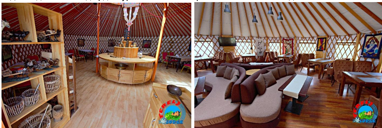
Зураг 6. Монгол гэр ресторан, гэр лаунж

Монгол гэр ресторан, гэр лаунж: Ресторан тус бүр нэг дор 30-40 хүн хүлээж авах хүчин чадалтай бөгөөд монгол үндэсний төрөл бүрийн хоол, хорхог, шорлог болон ази, европ хоолоор үйлчилдэг ба менюгээр болон өөрөө өөртөө үйлчлэх гэсэн хэлбэртэй. Энэ нь тусгайлан зассан саравчин дор шорлог хийх үйл явцыг тайлбартайгаар зочдод харуулан, гадаа задгай талбайд ардын урлагийн тоглолт үзэн байгалийн сайханд хооллох боломжтой.