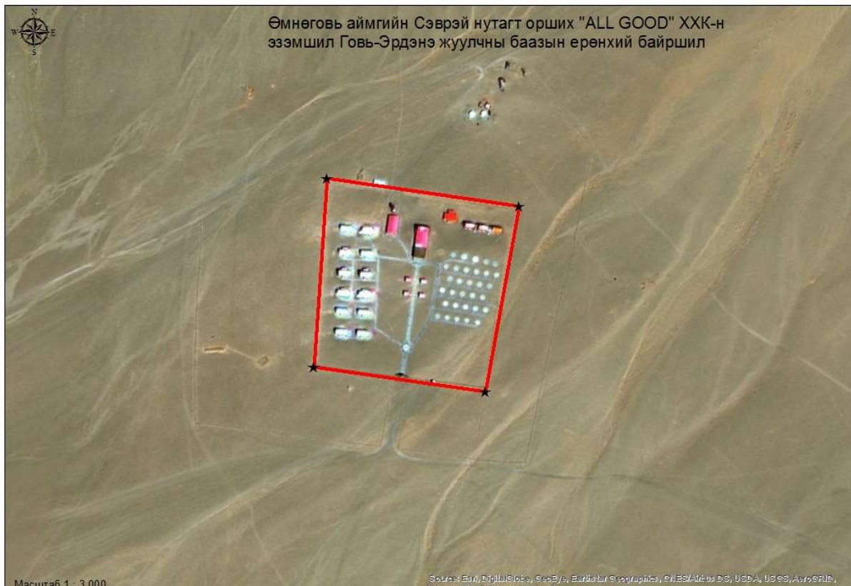
Зураг 01. Сансрын зураг\ Esri Basemap\