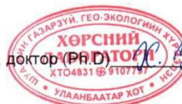
Зураг 5. Хөрсний шинжилгээний хариу