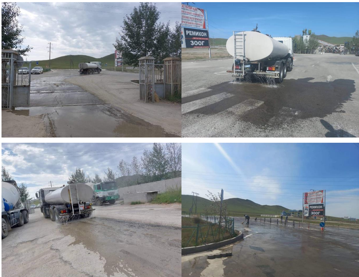
Зураг 3. Үйлдвэрийн зам талбайг услах, шүүрдэж цэвэрлэх ажлын үйл явц