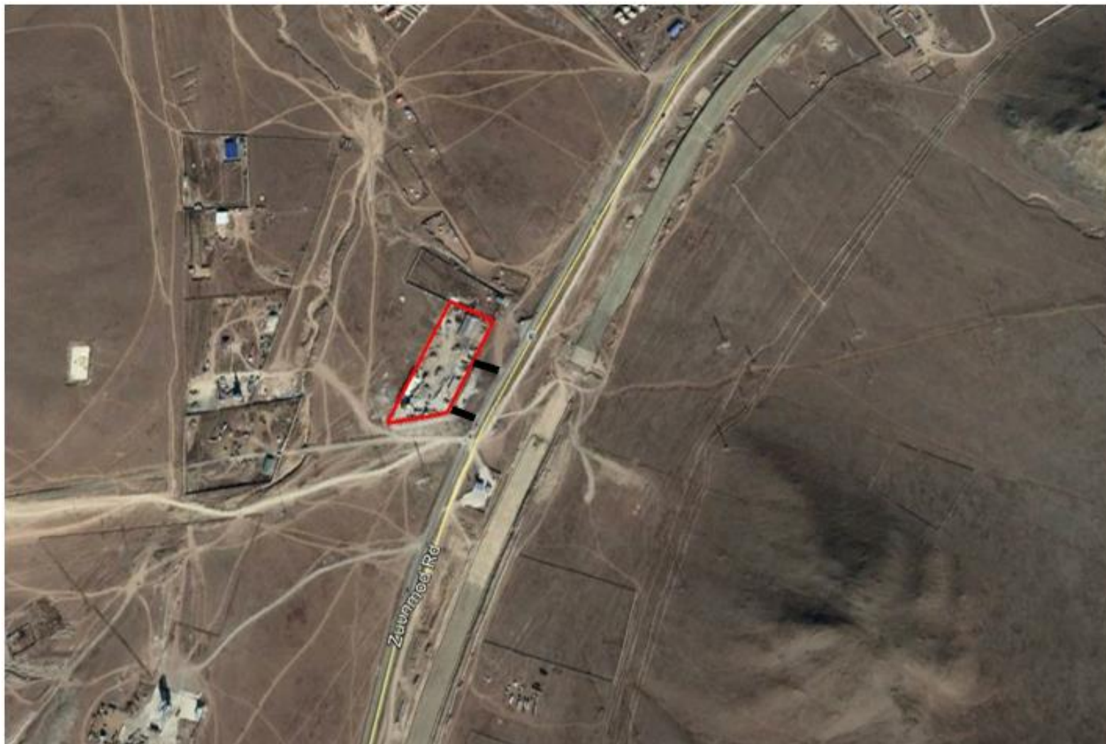
Зураг 1. Төслийн байршлын зураг