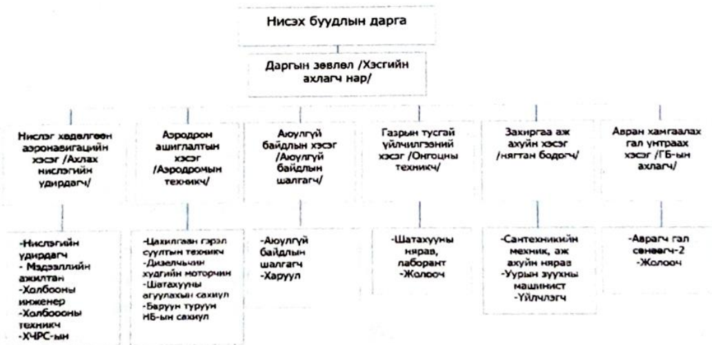
Зураг 1.2 "Дэглий цагаан" нисэх буудлын бүтэц, зохион байгуулалтын схем

ИНЕГ Төрийн өмчит Увс аймаг дахь салбар нь хуулийн этгээдийн эрх эдлэхгүй, эрх бүхий байгууллагаас баталсан журмын дагуу үйл ажиллагаа явуулна. Эрх бүхий этгээд нь Иргэний Нисэхийн Ерөнхий Газар байна.