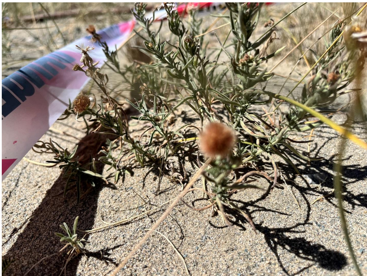
Зураг 25,26: Ургамалын судалгаа авсан талбай