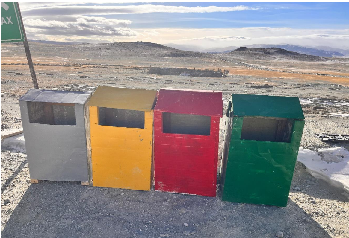
Зураг 35: Хогын савнууд

Оффисоос гарч буй цаасны хаягдлыг (бүх төрлийн цаасан хайрцаг, ногоогүй шохойгүй хоол хүнсний бохирдолгүй байх) зориулалтын хогны саванд ангилан хаядаг.