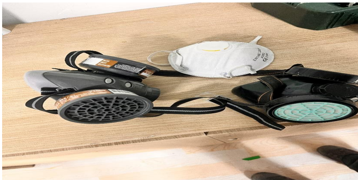
Зураг 1, 2 Уурхайд хэрэглэж байгаа маскны төрлүүд

Орчны тоосжилт болон салхины хурд, дуу чимээг бууруулах, орчны тохижилтыг сайжруулах зорилгоор болон “Тэрбум мод” хөтөлбөрт хамарагдаж баяжуулах үйлдвэрийн эргэнд хайлаас, улиас, бургас зэрэг модны төрлүүдийг 3000 м 2 болон 3 га талбайд тарьсан.