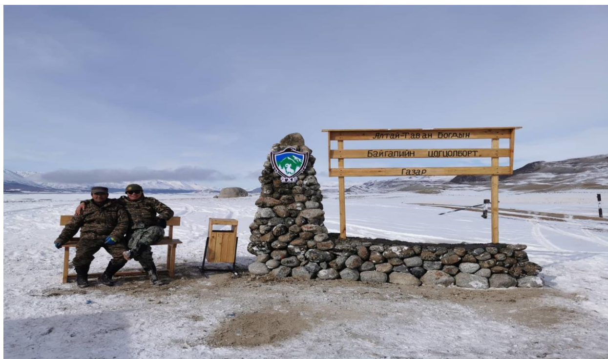
Зураг 31,32, 33, 34 Угтах хаалга хийж байгаа нь