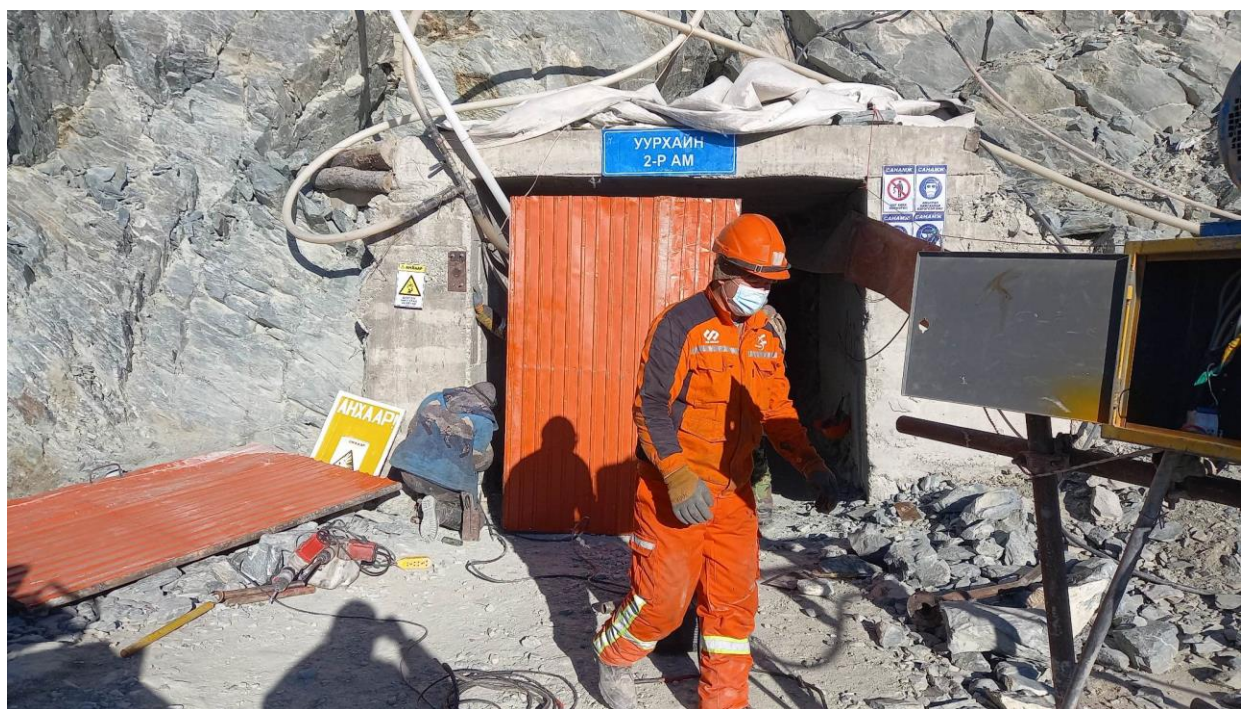
Зураг 19, 20: Уурхайн бүс хаалга болон аюулгүй ажиллагааны тэмдэг тэмдэглэгээ