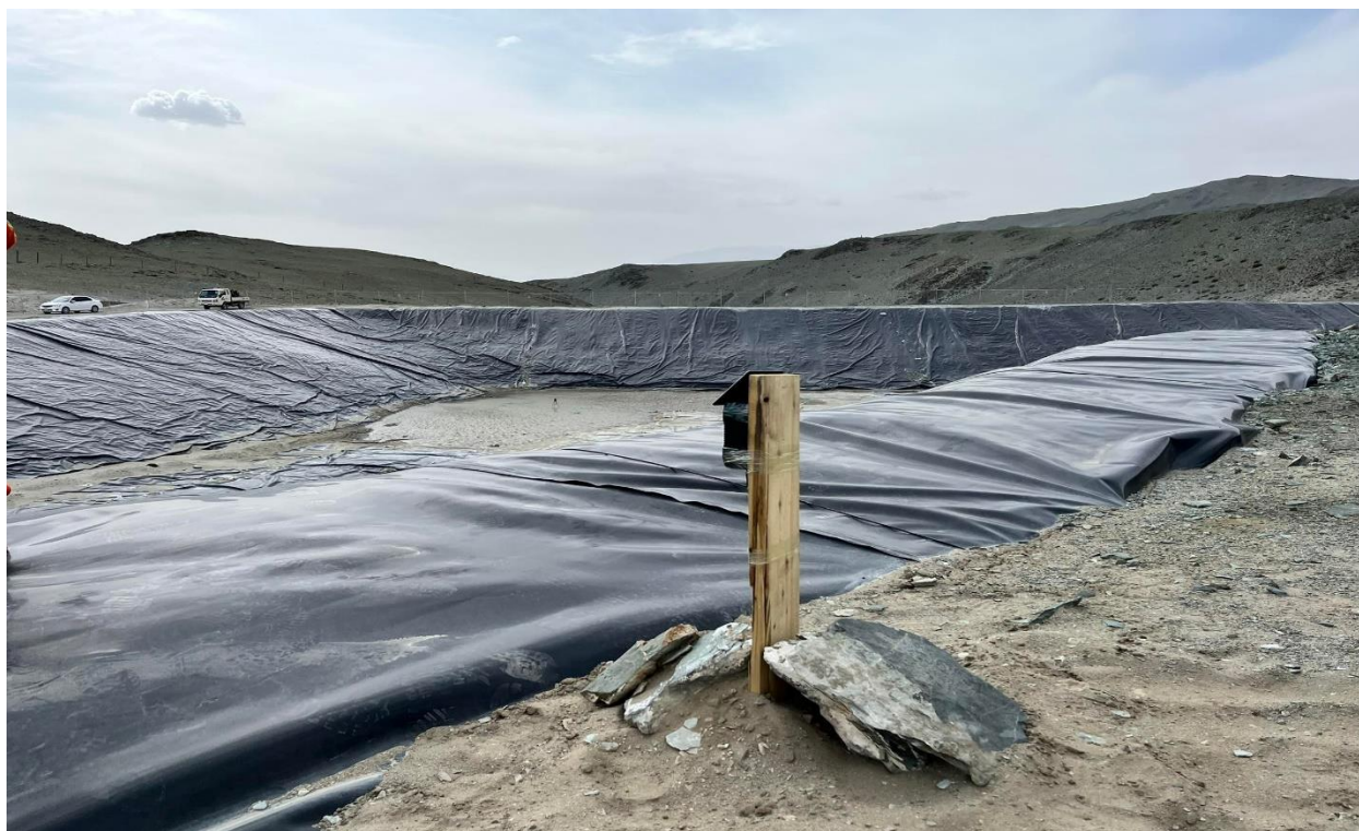
Зураг 27, 28 Шувуу үргээгч вращ