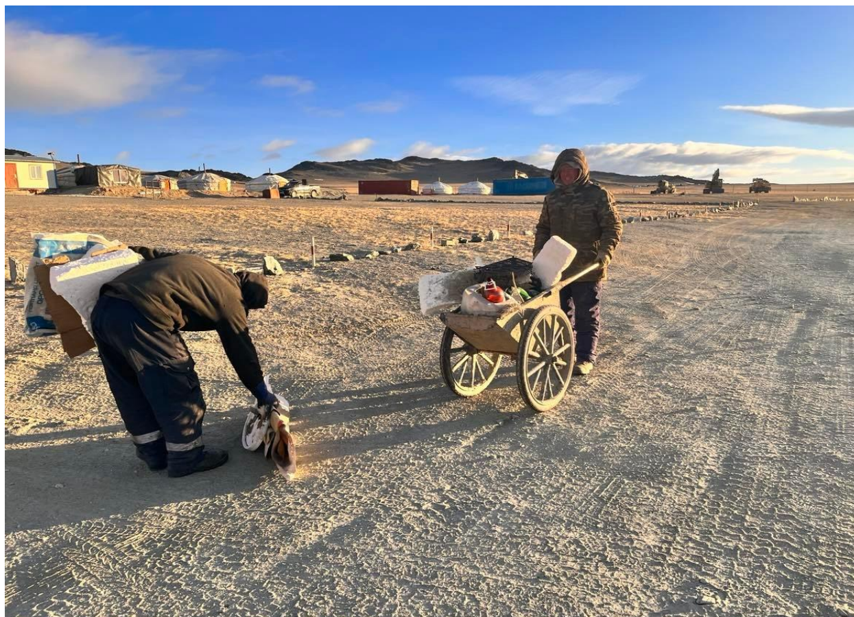
Зураг 36: Цэвэрлэгээ хийх үед

Хог хаягдлын цэгийг тогтмол ариутгаж үйлдвэрийн эргэн тойроны нийтийн цэвэрлэгээг 14 хоногт 1 удаа зохион байгуулдаг.