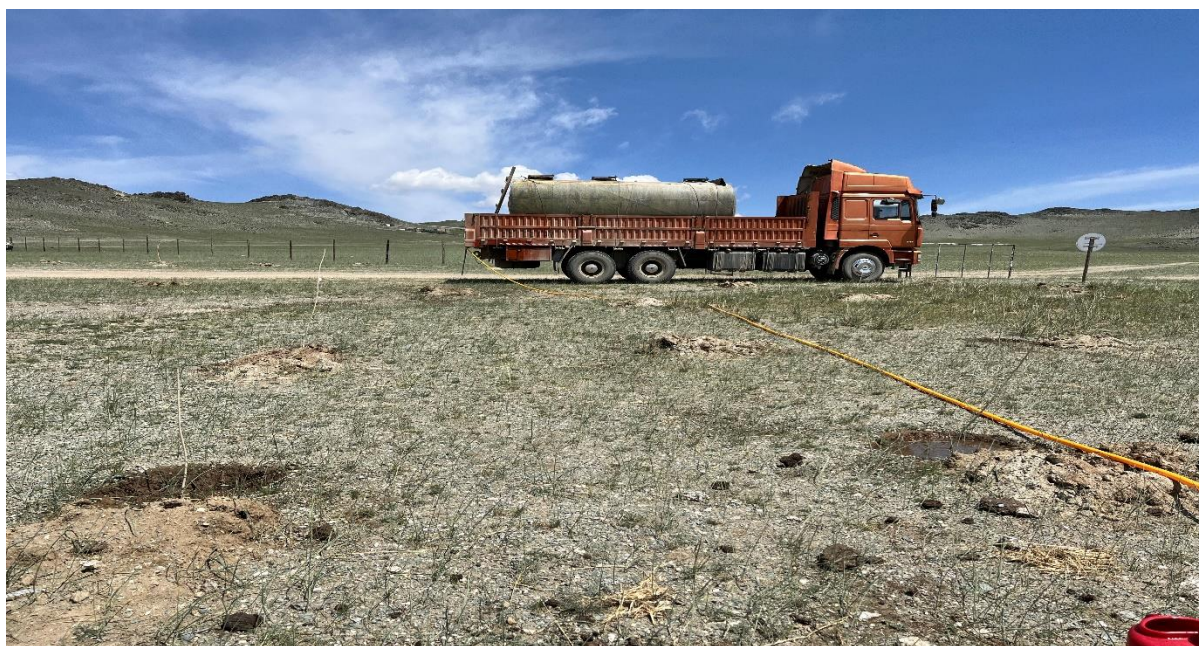
Зураг 9, 10: Мод услах үе