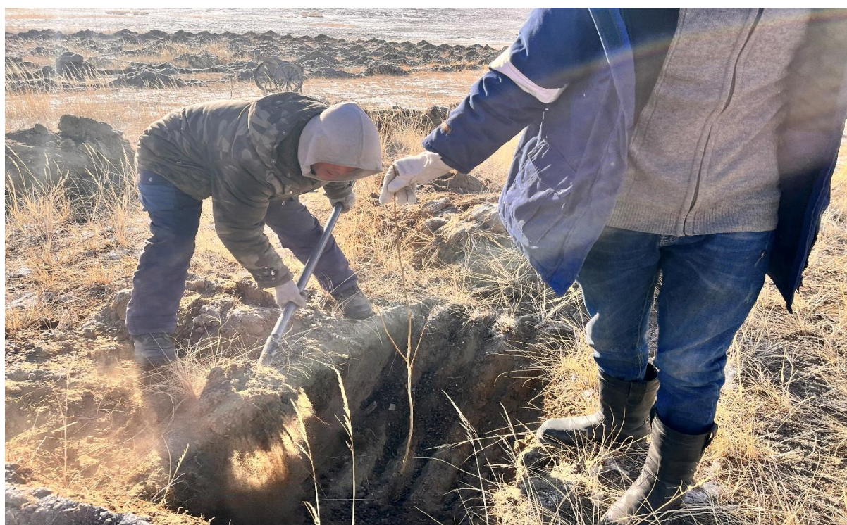
Зураг 3,4,5,6: Мод тарьж байгаа нь