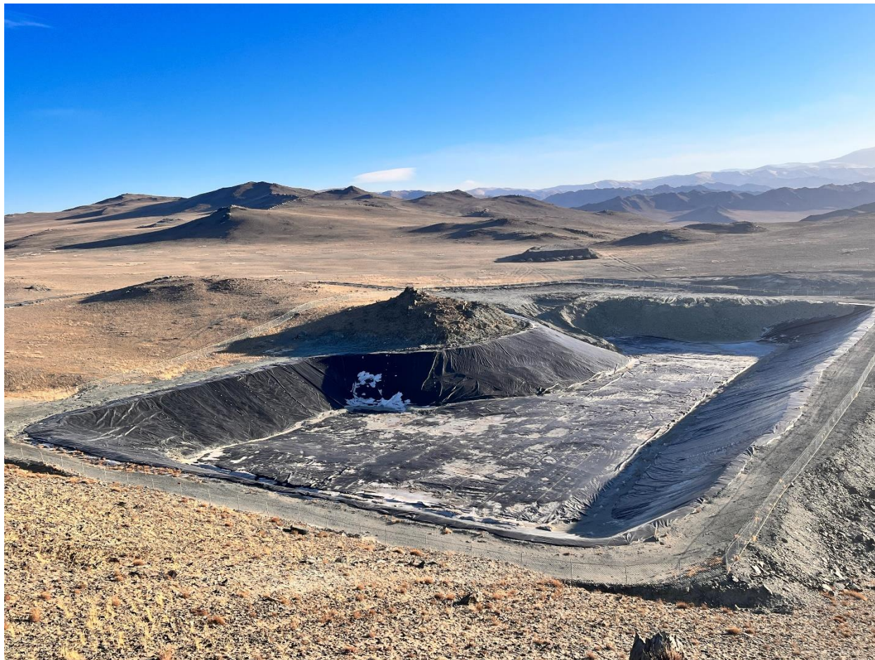
Зураг 18: Хаягдалын далан

Хаягдлын далангийн үер ус зайлуулах суваг шуудууг хамгаалалтын бүрэн бүтэн байдлыг тогтмол хянаж, сэргээн засах ажлыг жил бүр зохион байгуулдаг.