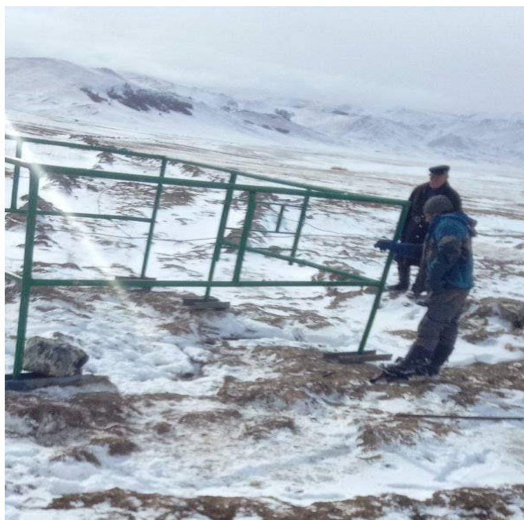
Зураг 29,30: Булаг хашааллаж байгаа нь