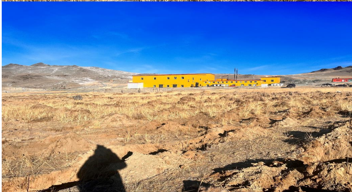
Зураг 7,8: Мод суулгах талбай бэлдсэн нь