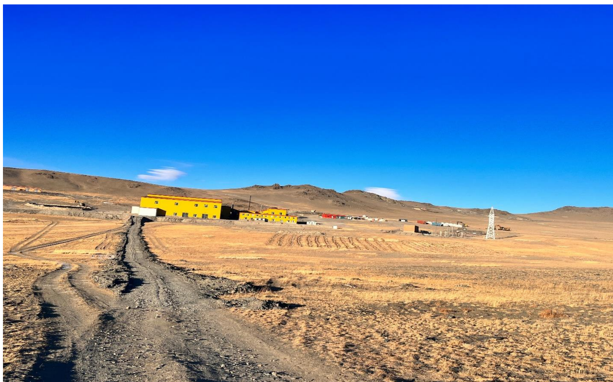
Зураг 13,14, 15 Хоосон чулууг зам талбайд ашиглаж байх нь