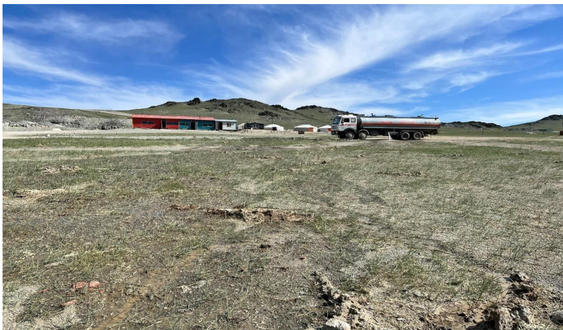
Зураг 11,12: Зам талбайг услах нь