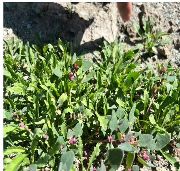
Зураг 21- 24: Ургамлын төрлүүд