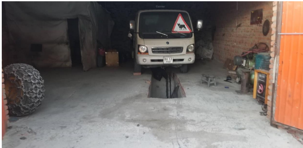
Зураг 16, 17 үйлдвэрийн засварын цех нь

Машин механизмын засвар үйлчилгээг зөвхөн зориулалтын засварын байр талбайд хийж гүйцэтгэдэг.