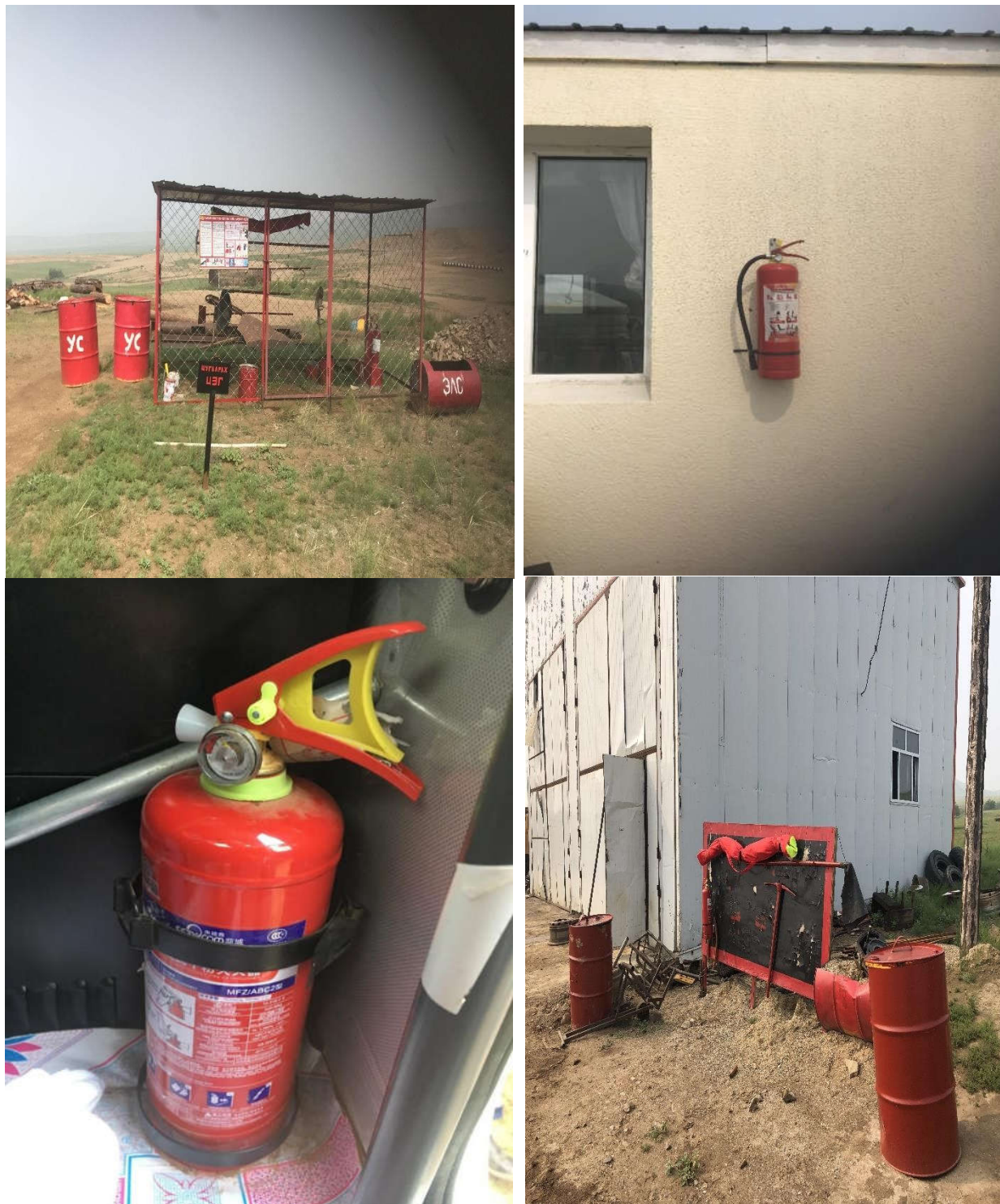
Зураг 9. Галаас хамгаалах хэрэгсэл байршуулсан байдал