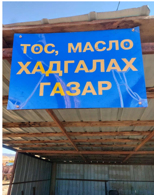
Зураг 14. Хэрэглэсэн тос масло хадгалах газар