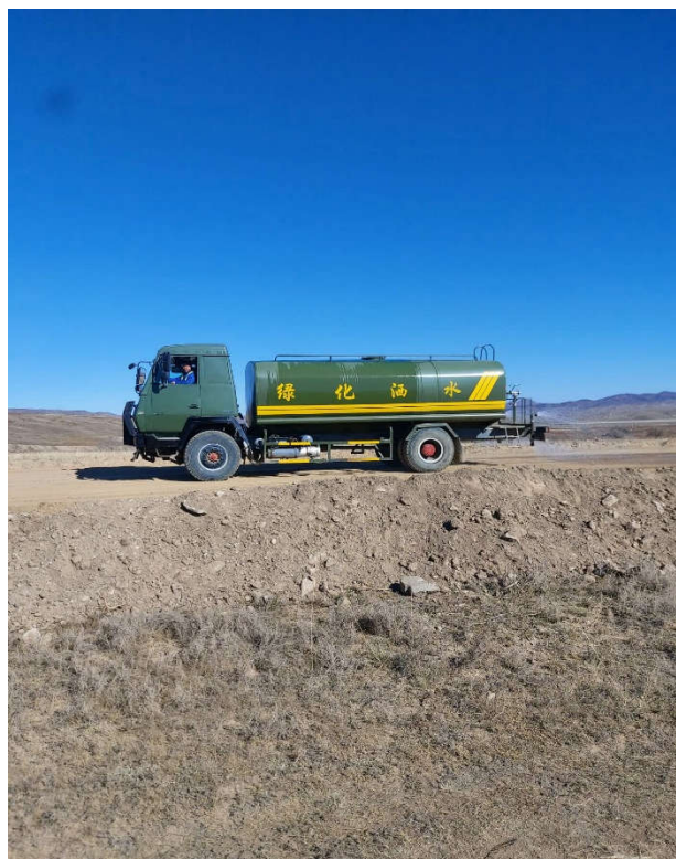
Зураг 2. Усалгаа хийж байгаа байдал