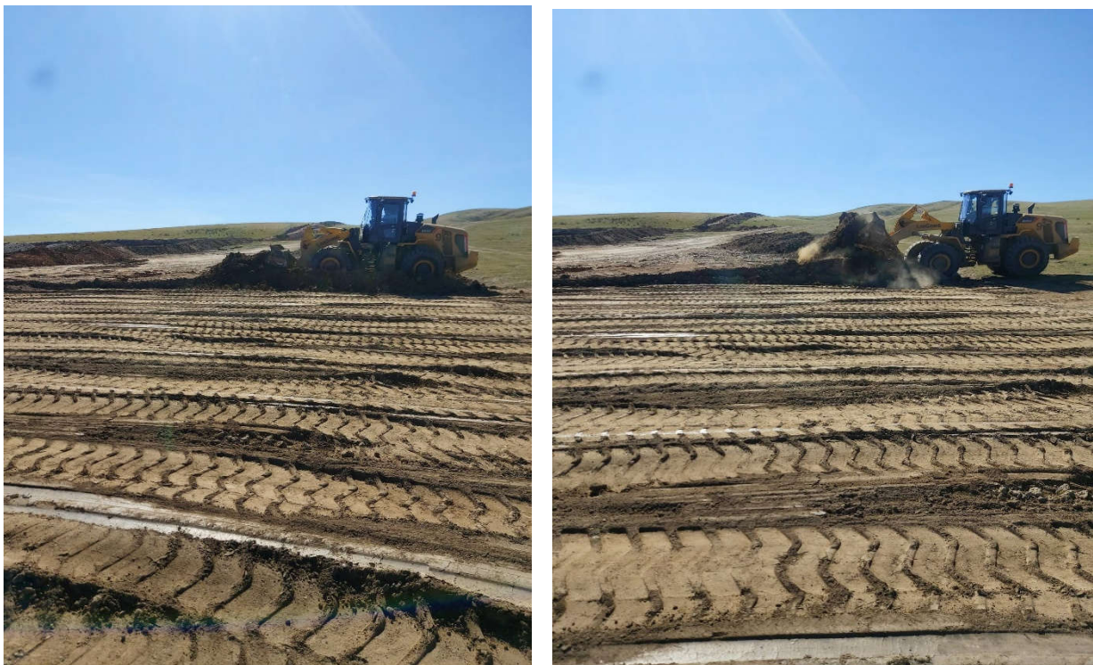
Зураг 6. Техникийн нөхөн сэргээлт хийсэн байдал