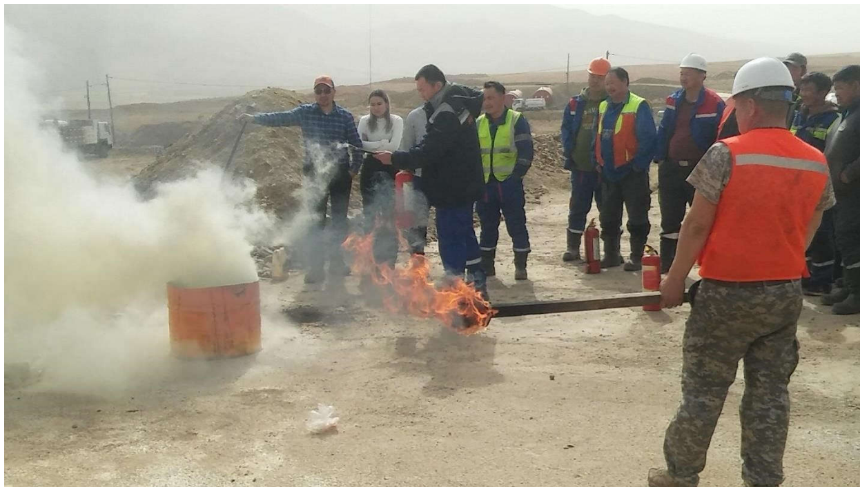
Зураг 10. Галын хор ашиглах талаарх сургалт зохион байгуулж байгаа байдал