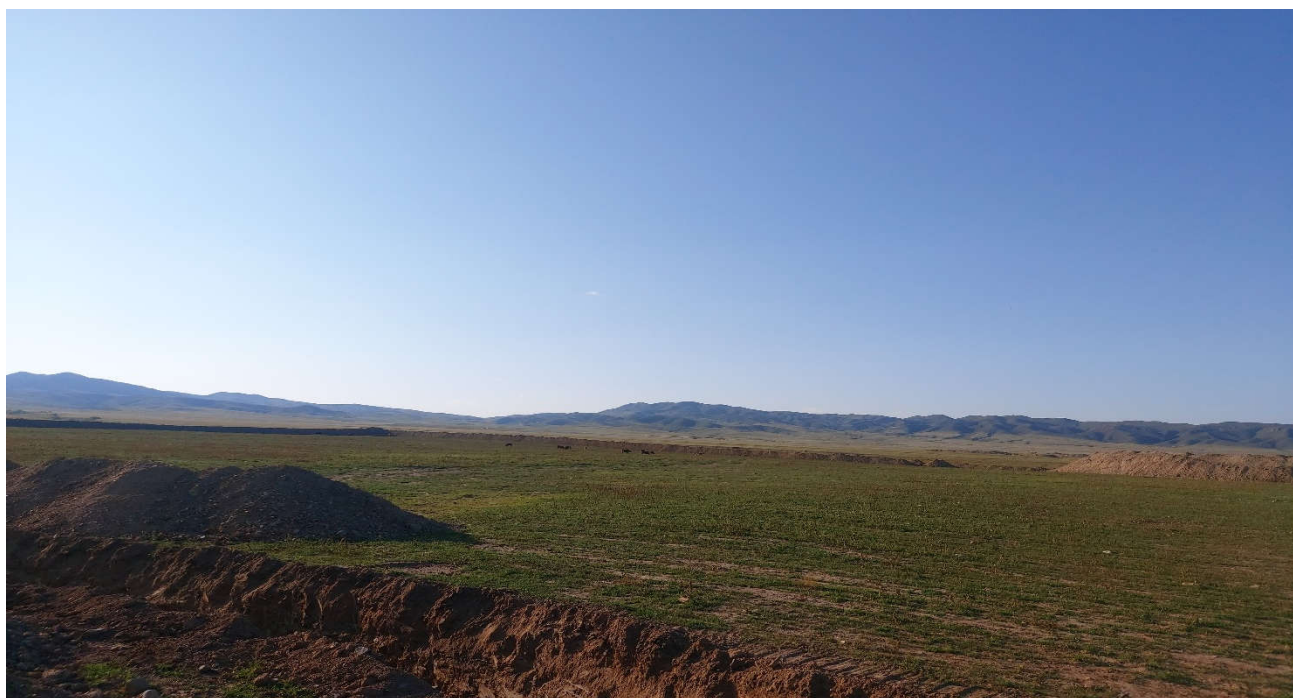
Зураг 8. Биологийн нөхөн сэргээлт хийгдсэн байдал