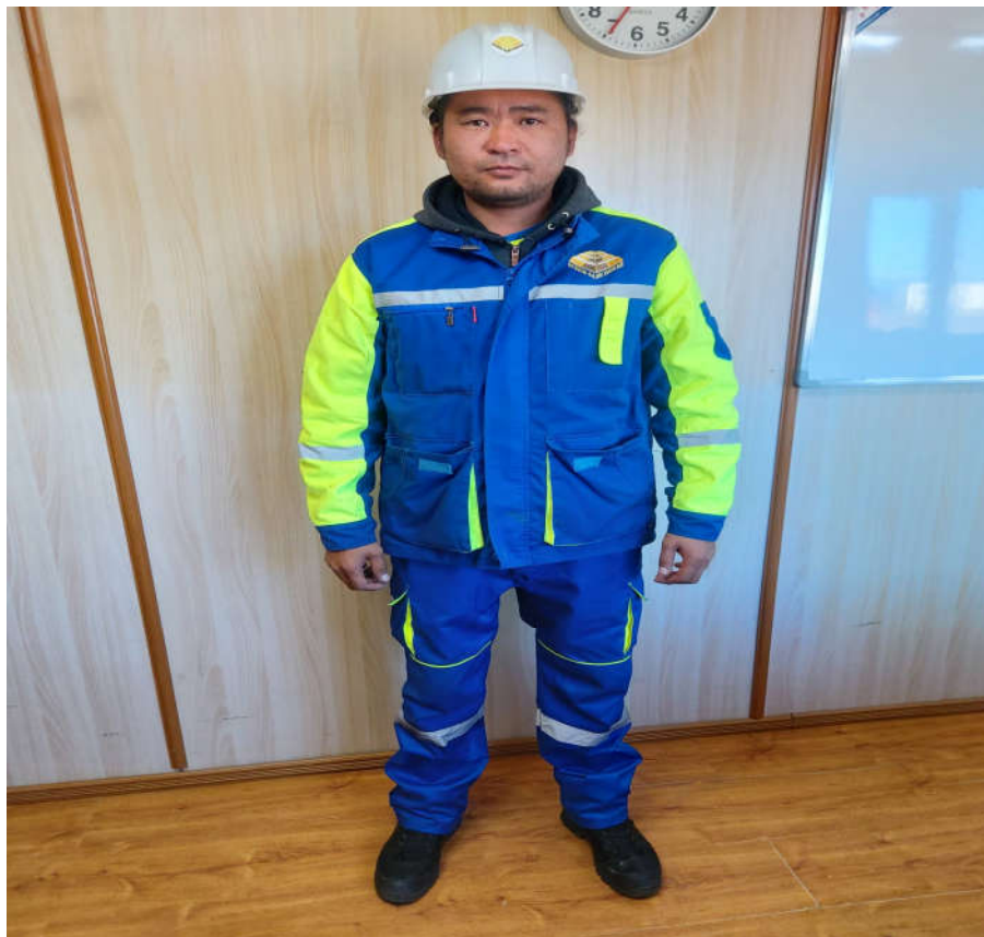
Зураг 11. Хөдөлмөр хамгааллын хувцас хэрэгслээр хангагдсан байдал