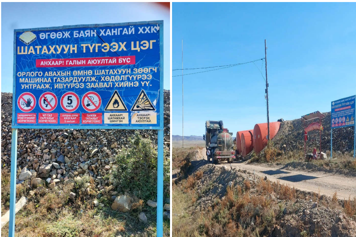
Зураг 5. ШТМ хадгалах ёнкос