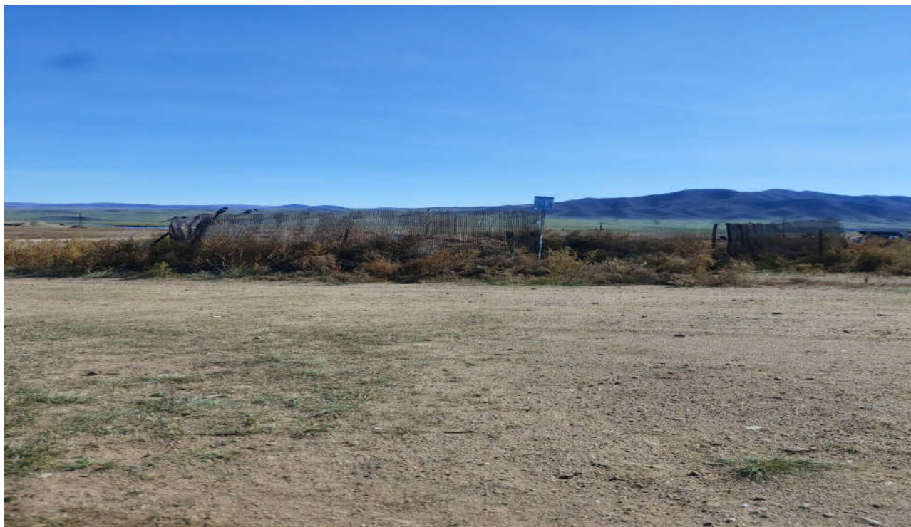
Зураг 13. Хог хаягдлын цэгийг тойруулан хашсан байдал