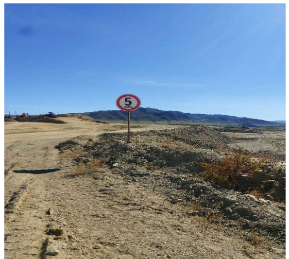
Зураг 4. Таних тэмдэгүүд