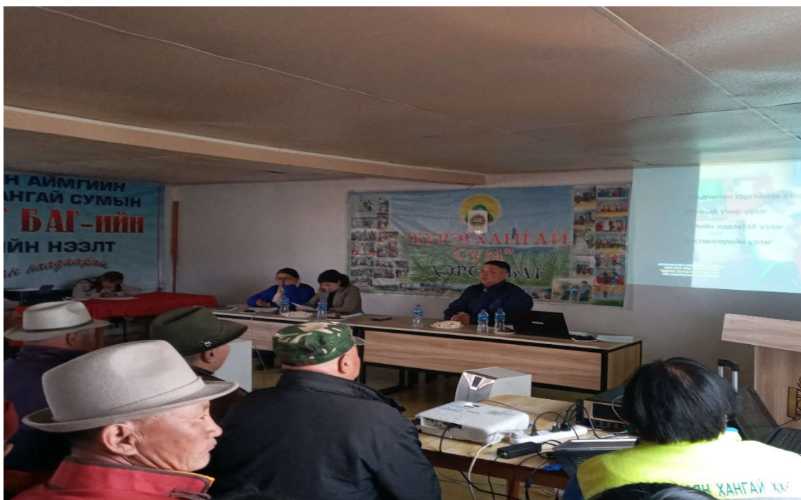
Зураг 15. Багийн ИНХ-д тайлагнаж байгаа байдал