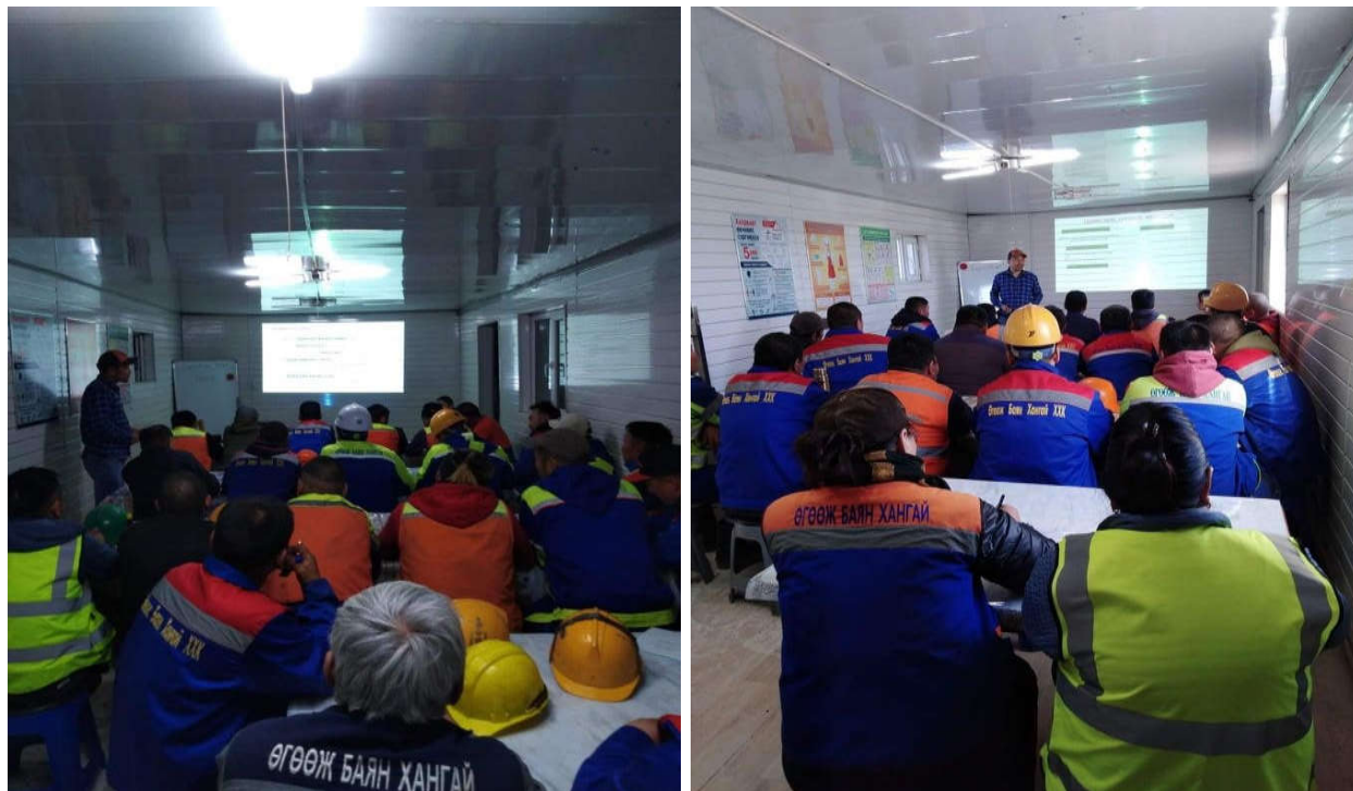
Зураг 12. ХАБЭА-н сургхлт хийж байх үеийн зураг